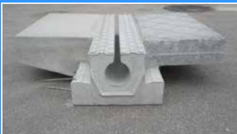
Die Schieberentwässerungsrinne ist sowohl mit Laufangelementen als auch mit Ortsbeton verwendbar.