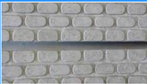
Oberflächenstruktur der Entwässerungsrinne.