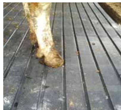
Encrassement résiduel minimal après le nettoyage des vannes