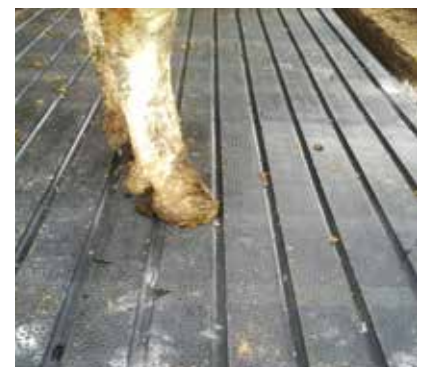
Minimale Restverschmutzung nach Schieberreinigung