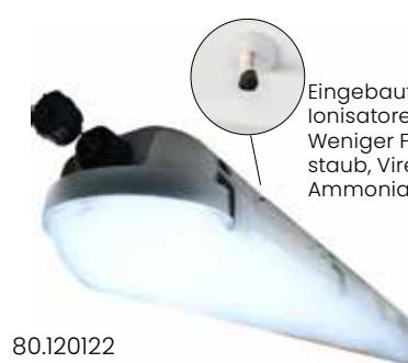
Eingebaute Ionisatoren: Weniger Feinstaub, Viren, Ammoniak.