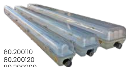
80.200110 80.200120 80.200200 80.200199 (nicht dimmbar)