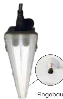
Eingebaute Ionisatoren: Weniger Feinstaub, Viren, Ammoniak.